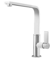
Mischbatterie NYC 8486 000