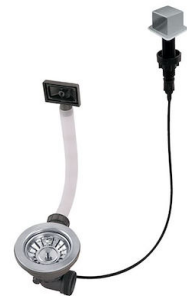
Automatischer Abfluss LIRA 8407 103